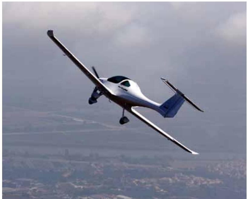
Abajo La estabilidad es positiva en los tres ejes aunque el lateral es ligeramente inestable.