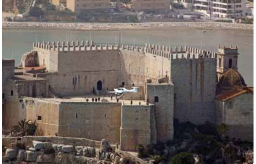
Abajo Preciosa la vista del castillo de Peñíscola y el Faeta ¿en corta final?...

Distribuidor para España: Aeroimport Maestrat Apdo 382 12500 Vinaròs (Castellón) Tel.- 676492353 Fax.- 964407696 www.aeroimport.com info@aeroimport.com