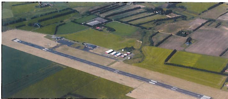
• Letiště v Odense na ostrově Fyn. Název města pochází ze slov Odins Vi, tedy Odinovo místo, a odkazuje na severskou mytologii.

Naše tulení mise byla úspěšně završena, a jelikož na Anholtu nejsou žádná turistická zařízení, vracíme se zpět na Sjaelland. Cestou zesiluje západní vítr a vzhledem k tomu, že se již touto dobou začínají dny zkracovat, s návratem si musíme pospíšet. Se západem slunce přistáváme na malém, travnatém, neveřejném UL letišti jen pár domů za romantickým přístavem Gilleleje, abychom navštívili dalšího z našich dánských přátel, který si tu vybudoval malou soukromou travnatou plochu a hangárek pro svá tři letadla, Zephyra, Faetu a motorového kluzáka.