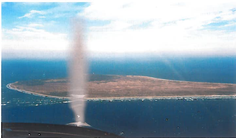
• Před námi je ostrov Anholt.

P řestože Dánsko na Skandinávském poloostrově neleží, při vyslovení jeho názvu se snad každému vybaví pojmy jako Skandinávie, Vikingové, Hamlet či malá mořská víla. Pokud ale očekáváte hluboké fjordy a divokou přírodu plnou vodopádů, budete zklamáni. Je to rovinatá země plná cyklostezek, a tak cyklistům nebo spíše rovinkovým pohodářům zdejší krajina se svým nejvyšším vrcholem pouhých 171 m n. m. opravdu přeje. Na rozdíl od počasí, které je vpravdě skandinávské. Studený, neutichající vítr od Baltu nahrazuje vrchařské túry a slunce tu každou chvíli střídají přeháňky.