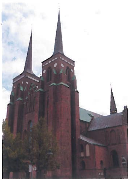
• Katedrála v Roskilde.