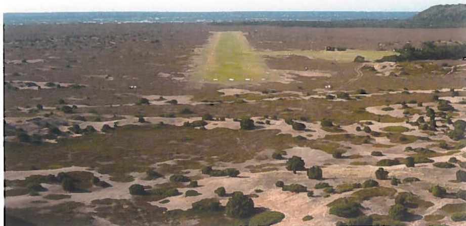
• Přiblížení na ostrovní letiště Anholt.

ale tím strávíte celkem alespoň hodinu. Z nádraží v Roskilde pak jezdí vlaky do Kodaně po pár minutách a cesta potom trvá asi 20 minut.