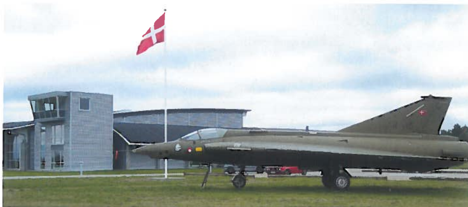
• Letecké muzeum na letišti Stauning.

Pro ty z vás, kteří rádi navštěvujete letecká muzea, pak nelze pominout další cíl, a tím je „Dansk Veteranflysamling Lufthavnsvej Stauning“ aneb Sběrka historických dánských letadel, kterou najdeme na letišti Stauning (EKVJ) u města Skjern. Pokud už jste na západním pobřeží, vyplatí se podívat se na sever a navštívit třeba Morsø (EKNM) a pak pokračovat nad pobřežím třeba až k severnímu cípu Dánska. K vidění toho určitě najdete v Dánsku mnoho. FR