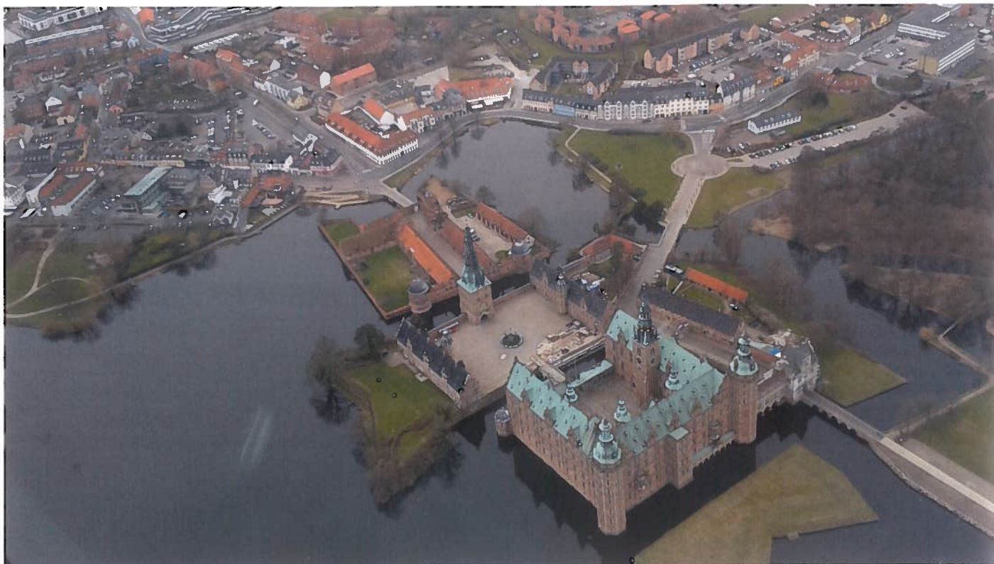
• Zámek Frederiksborg v Hillerødu na dánském ostrově Sjælland.

Na letišti v Gørløse jsme se ubytovali v malém srubu a dostali kola k zapůjčení, stejně jako to je i na většině ostatních dánských letišť. Kolo je v Dánsku všude k máni a také se na něm všude bez problémů dostanete. Po delším letu přijde malý cyklovýlet po okolí vhod.