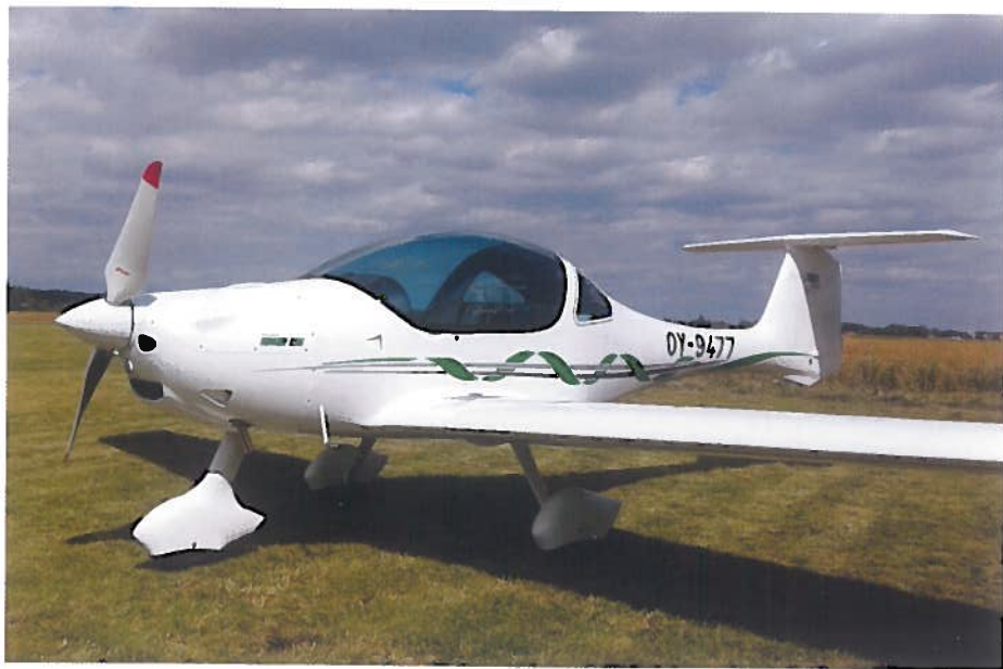
• Setkání s českými letouny v zahraničí vždy potěší. Zvláště když je to „naše“ Faeta.

několik stovek ostrovů a ostrůvků. Ty největší a nejdůležitější jsou sice spojeny úchvatnými mosty, ale chcete-li na chvíli uniknout civilizaci a vydat se na nějaký menší ostrůvek, nezbyvá než použít loď nebo letadlo. A právě tato malá, odlehlá ostrovní letiště jsou jedním z míst, která stojí rozhodně za to v Dánsku při leteckém výletě navštívit.