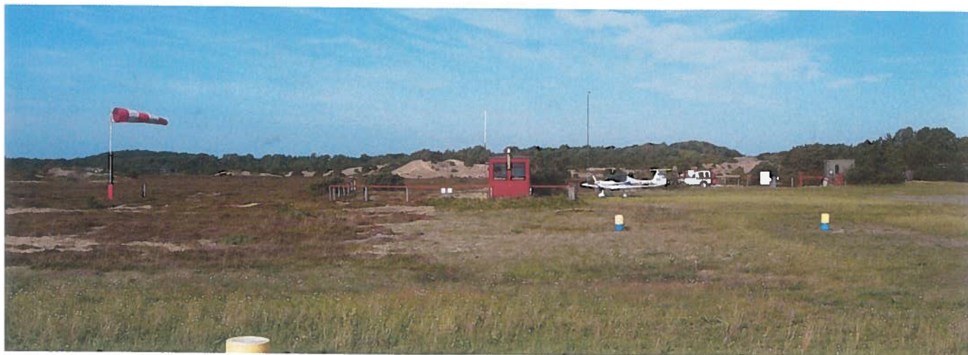
• Letiště na ostrově Anholt.