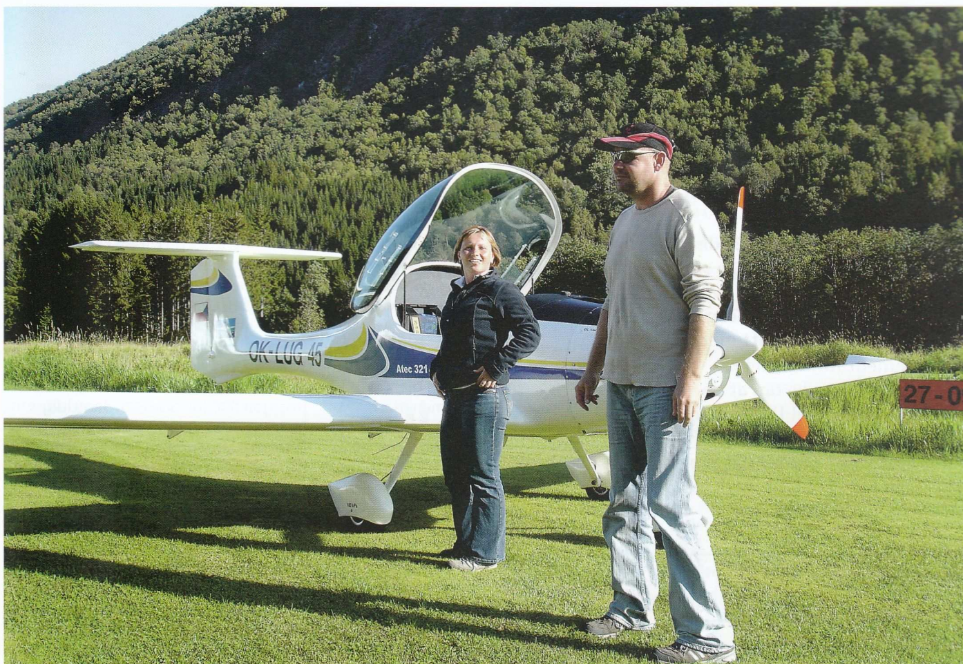
“Welcome to Stryn Internationall!”

Etter avgang fra Stryn er veien kort til både Skåla (1846 moh.), med sitt legendariske steintårn på toppen og til Lodalskåpa på 2083 moh. Herfra har man utsikt over hele Jostedalsbreen. Man ser Nordsjøen i vest, Skagastølstindane i sør, og Slogen og Hornindalsrokken i nord. Som oftest er det helt stille luft over breen i tillegg, noe som gjør nytelsen enda mer fullkommen.