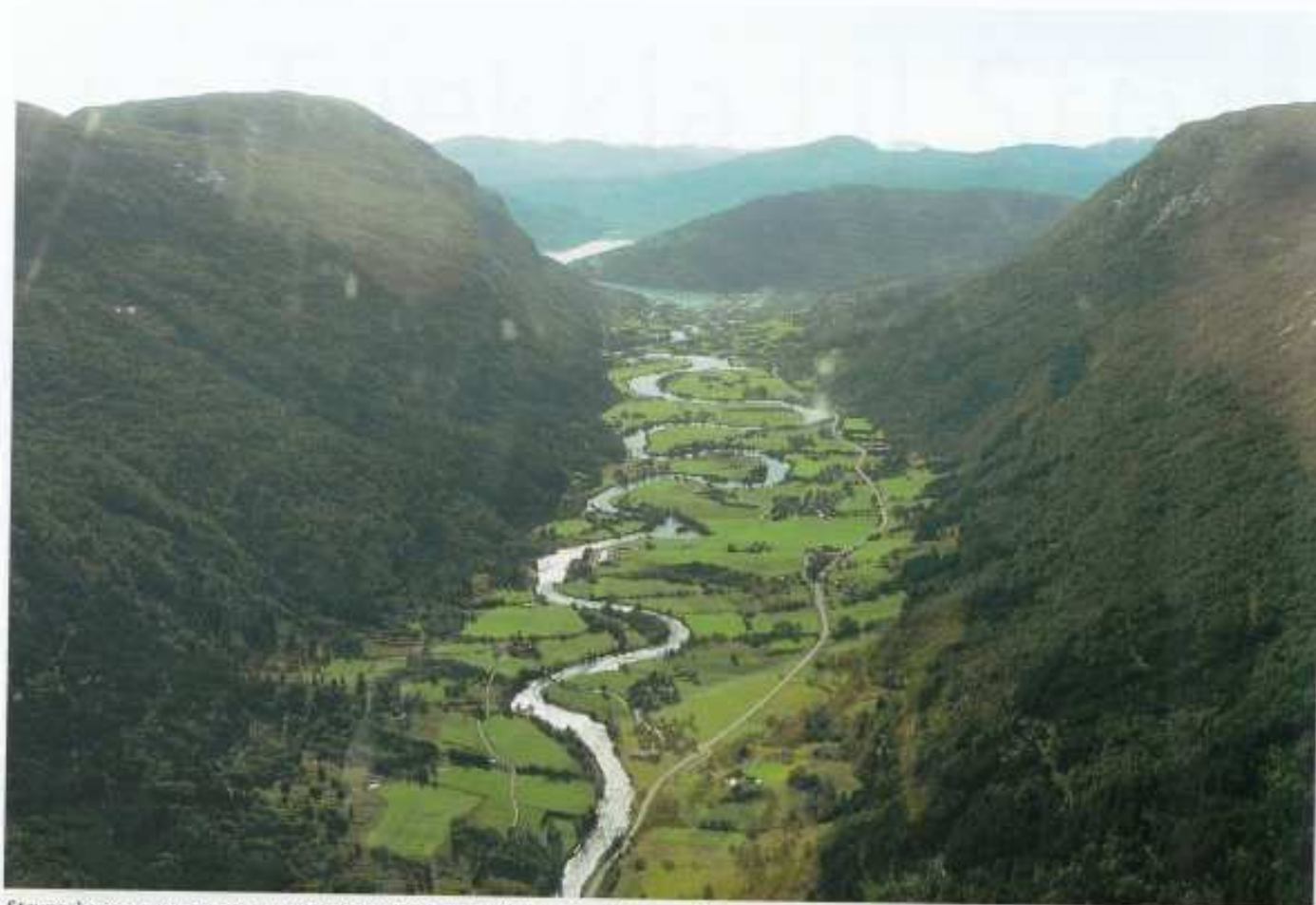
Strynseelva snor seg som en arm gjennom landskapet.