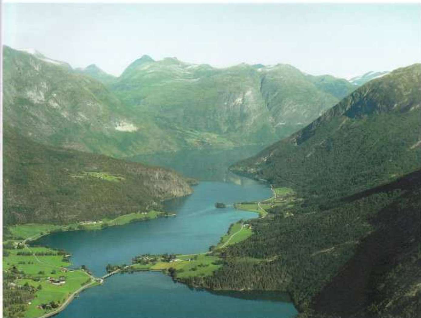
Fagre Stryn. Oppstrynsvannet ligger som et speil og Flobygda ligger badet i sol midt på bildet..

Da dalen åpnet seg med Flobygda på den ene siden Tindefjell og Lodalskåpa på den andre og Oppstrynsvannet som ett speil under oss, ble det stille på radioen ... lenge. Jeg tror det ble vått i øyekroken både på pilot og navigatør.