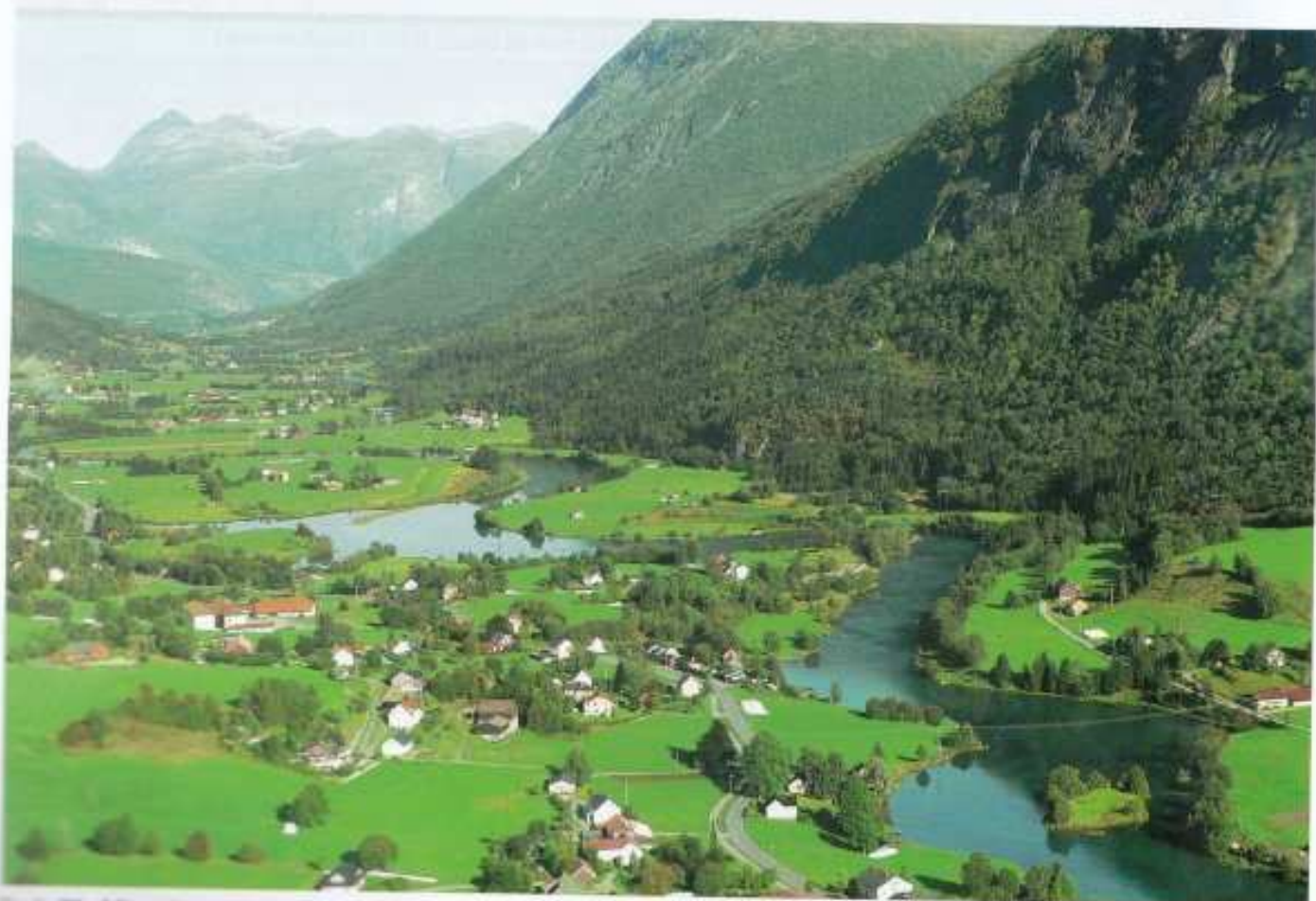
Finale 109 på Stryn International.