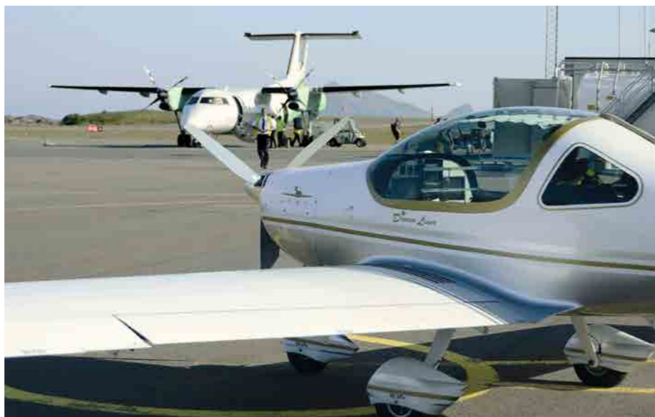
• Dash 7-300 a Faeta na stojánce letiště Svølvær Helle (ENSH)

Jaké bylo překvapení, když jsem po přistání ve Svølværu (ENSH) potkal u dráhy letiště zcela náhodou svého přítele Espena Strinda, kapitána letadla Dash 7-300 norských aerolinek Widerøe, které tu mělo