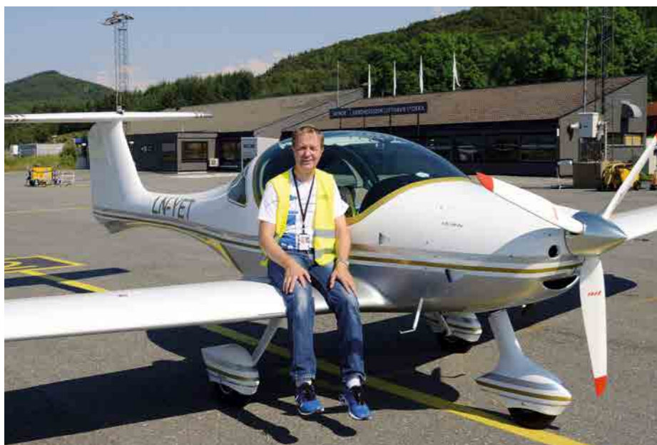
• Odpočinek na křídle Faety na letišti Stokka, Sandnessjoen (ENST)

ve svém středu protíná. V průběhu doby ledové provrtaly voda a kamení z tajícího ledovce napříč horou otvor, který je 160 m dlouhý, 35 m vysoký a 20 m široký. Neobvyklá procházka tunelem skrz horu je výjimečnou turistickou lahůdkou. Bohužel je však tato hora nechvalně známá rovněž díky tragédii letu 710, jež se zde odehrála 6. května 1988. Letoun typu DHC Dash 7 vnitrostátní linky letecké společnosti Wideroe, který mířil z Namsos na letiště Brønnøysund, narazil při přiblížení do boku hory a všech 36 cestujících včetně posádky zahynulo. Tato událost dokazuje, jak složité je létat ve složitém počasí a záludných podmínkách, které v této části Norska panují.