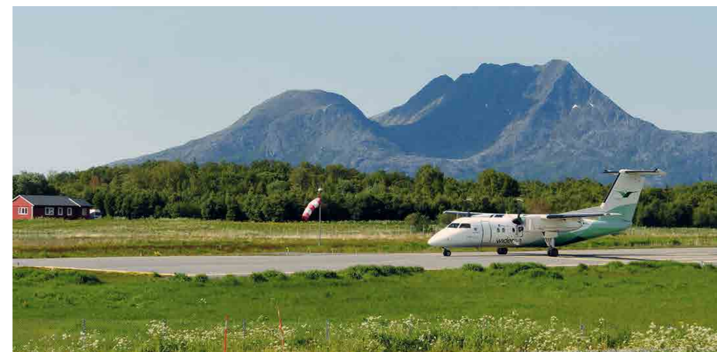
• Letiště Stokka, Sandnessjoen (ENST)

Lofoty jsou proslavené svými úchvatnými horskými scenériemi, skalními masivy nejrůznějších tvarů a nedotčenou přírodou. Lepší než ptačí pohled na tohle všechno jsme si nemohli přát. Všechny lofotské ostrůvky jsme teď měli jako na dlani. Pohodové létání nám umožnilo naplno pocítit opravdovou svobodu a volnost, ➡