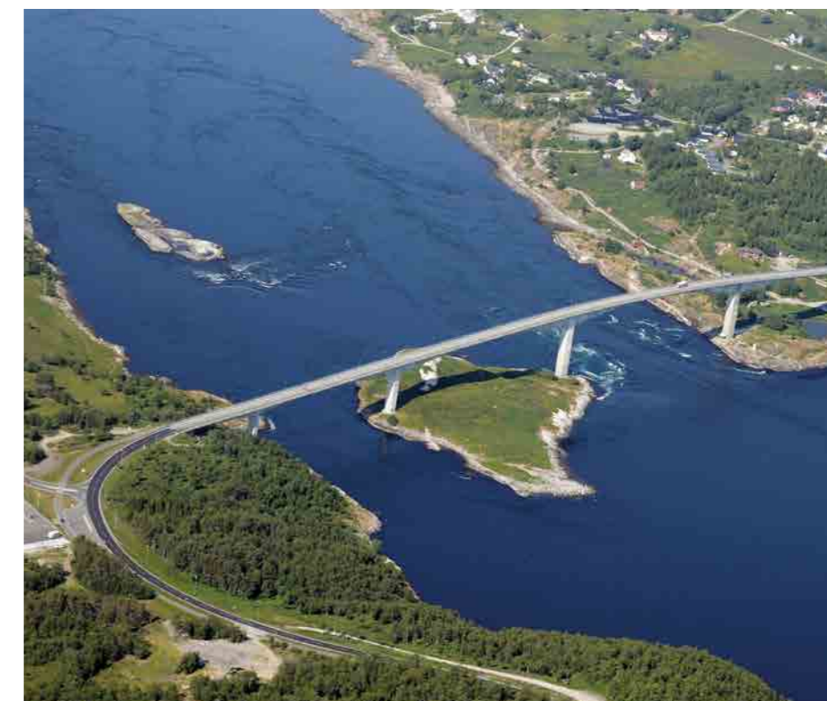
• Most přes úžinu Saltstraumen

V určitém období léta je za polárním kruhem těžké rozpoznat, je-li zrovna noc či den, což ale platí i v zimě. Jelikož se za letní noci usíná dost obtížně, ulice jsou stále plné lidí. Létal jsem celý den až do dvou hodin ráno, když mi mé tělo naznačilo, že je čas si oddechnout a pokusit se alespoň o trochu spánku.