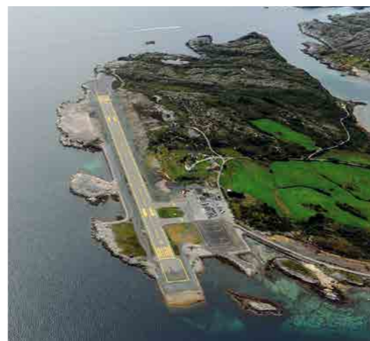
• Letiště Svolvær

Z letiště Brønnøysund jsme pokračovali dále na sever na letiště Stokka (ENST), ležící jižně od města Sandnessjøen. Teplota byla pro Norsko stěží uvěřitelných 33 °C! Byla téměř nejvyšší, co kdy byla v norské historii naměřena. Vysoká teplota pravděpodobně způsobí