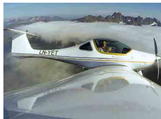
• Otočka zpět na Bodo