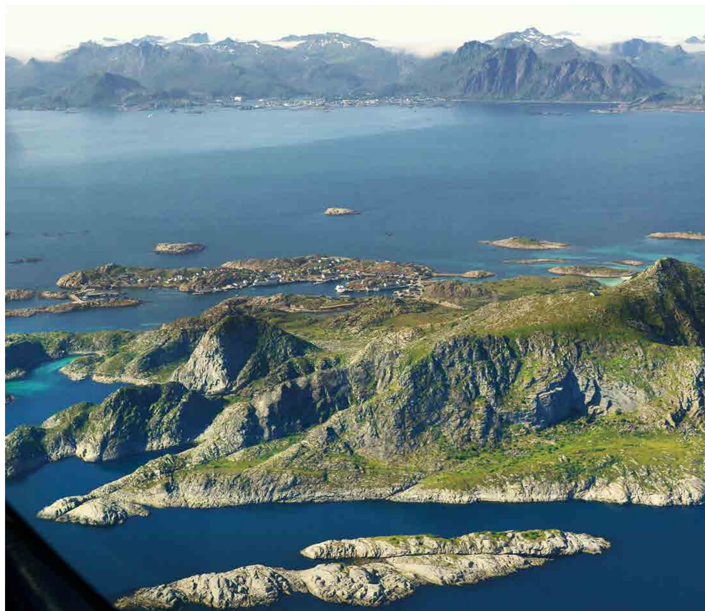
• Ostrov Skrova